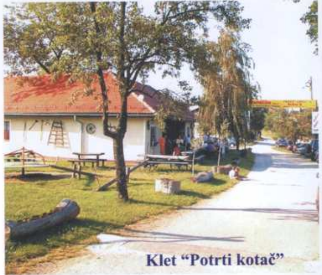
Klet "Potrti kotač"

KLET "POTRTI KOTAČ" , tel./fax.:040/868-318, Jurovčak nudi domaću kuhinju u jedinstvenom okruženju medimurskih brežuljaka, vinograda i šuma. Sve to samo je dio bogate ponude koja Vas očekuje posjetom tom restoranu. Raspolaze sa 150 mjesta i ljetnom terasom sa dodatnih 80 mjesta. Svadbene, poslovne i slične prigode na Vaše zadovoljstvo ćemo organizirati uz prethodni dogovor.