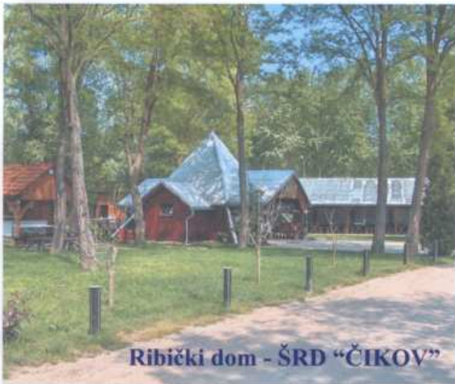
Ribički dom - ŠRD "ČIKOV"

ŠRD "ČIKOV" Sv. Martin na Muri, osnovano je 1990. godine. Danas broji oko 440 članova. Posjeduje vlastiti ribički dom na starom rukavcu rijeke Mure u Žabniku i Lapšini. Korisnik je ribolovnih voda od Bukovja na zapadu pa do Hlapičine na istoku Općine te ribolovno područje na lijevoj obali rijeke Mure, prema mjestima Hotiza, Kapca i Kot.