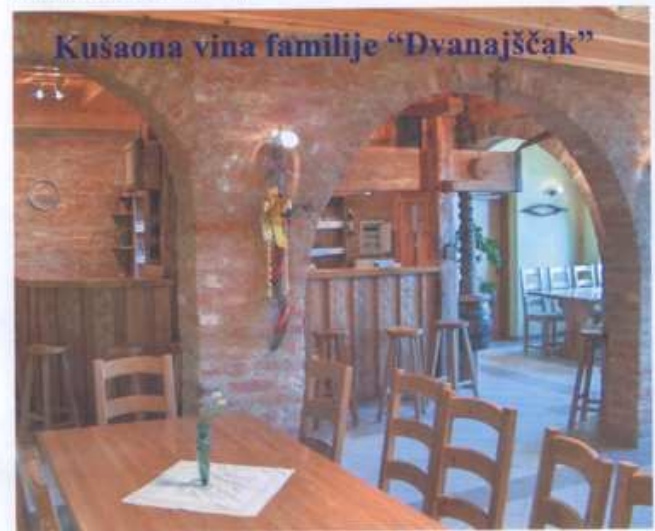
Kušaona vina familije "Dvanajščak"

Kušaona vina familije DVANAJŠČAK , Jurovčak 58, tel.:040/868-326, otvorena je na seljačkom obiteljskom gospodarstvu. Prima grupe do 50 osoba, a poslužuje domaće jelo i piće. Prošetate li imanjem možete vidjeti lopatare i muflone.